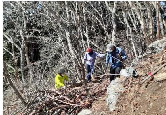
西側崖の伐採小枝の片付け作業