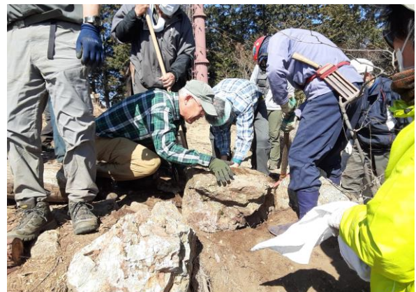
ベンチ設置個所の露岩の配置転換