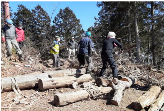
野積みの伐採小枝を南斜面に移動